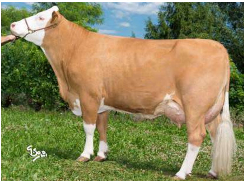
IT093990153679 figlia del toro italiano MASSIMILIANO